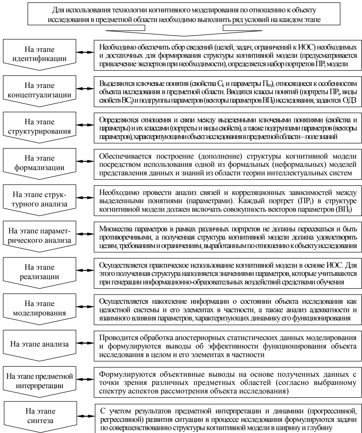
Рис. 1. Методика использования технологии когнитивного моделирования

Соответственно КМ дифференцируется на КМ субъекта (параметры, характеризующие ЛХО) и КМ средства обучения (параметры, характеризующие потенциально возможные типы и виды генерируемых информационно-образовательных воздействий).