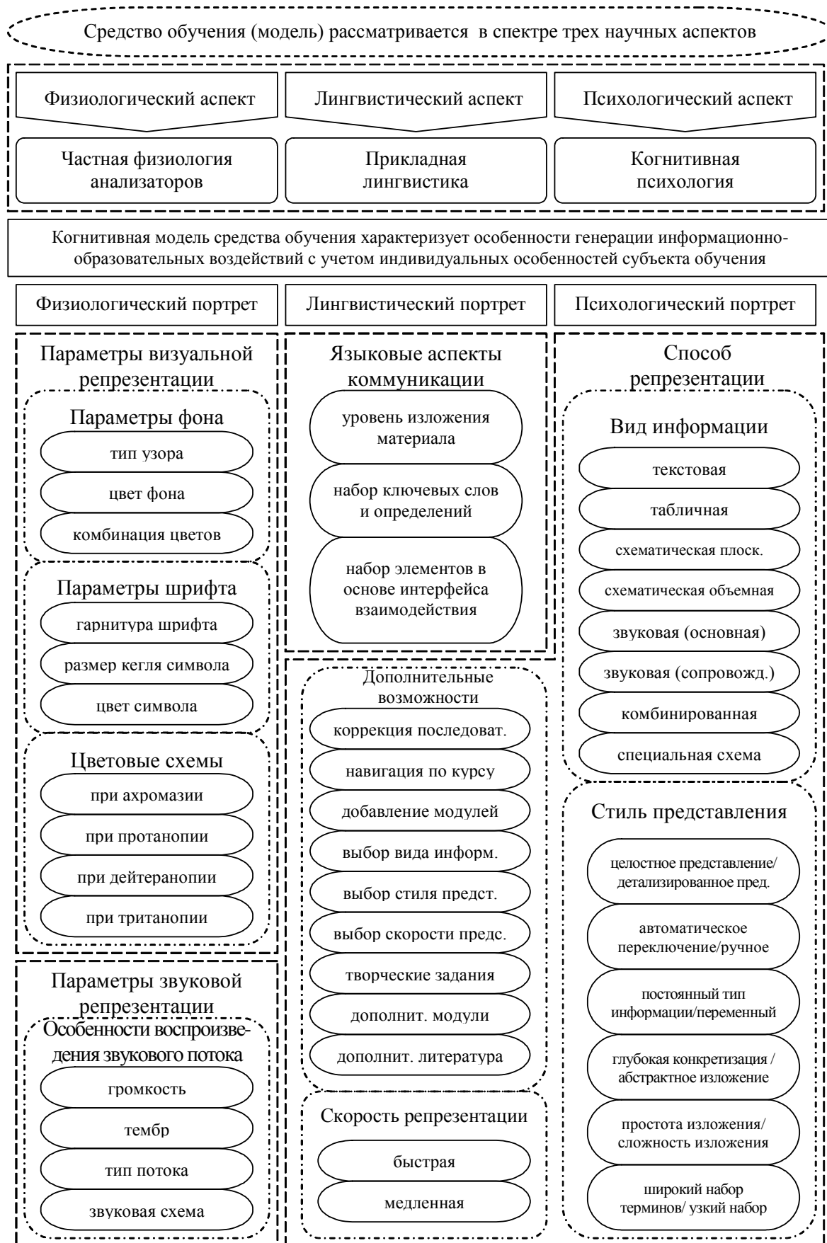
Рис. 4. Когнитивная модель средства обучения