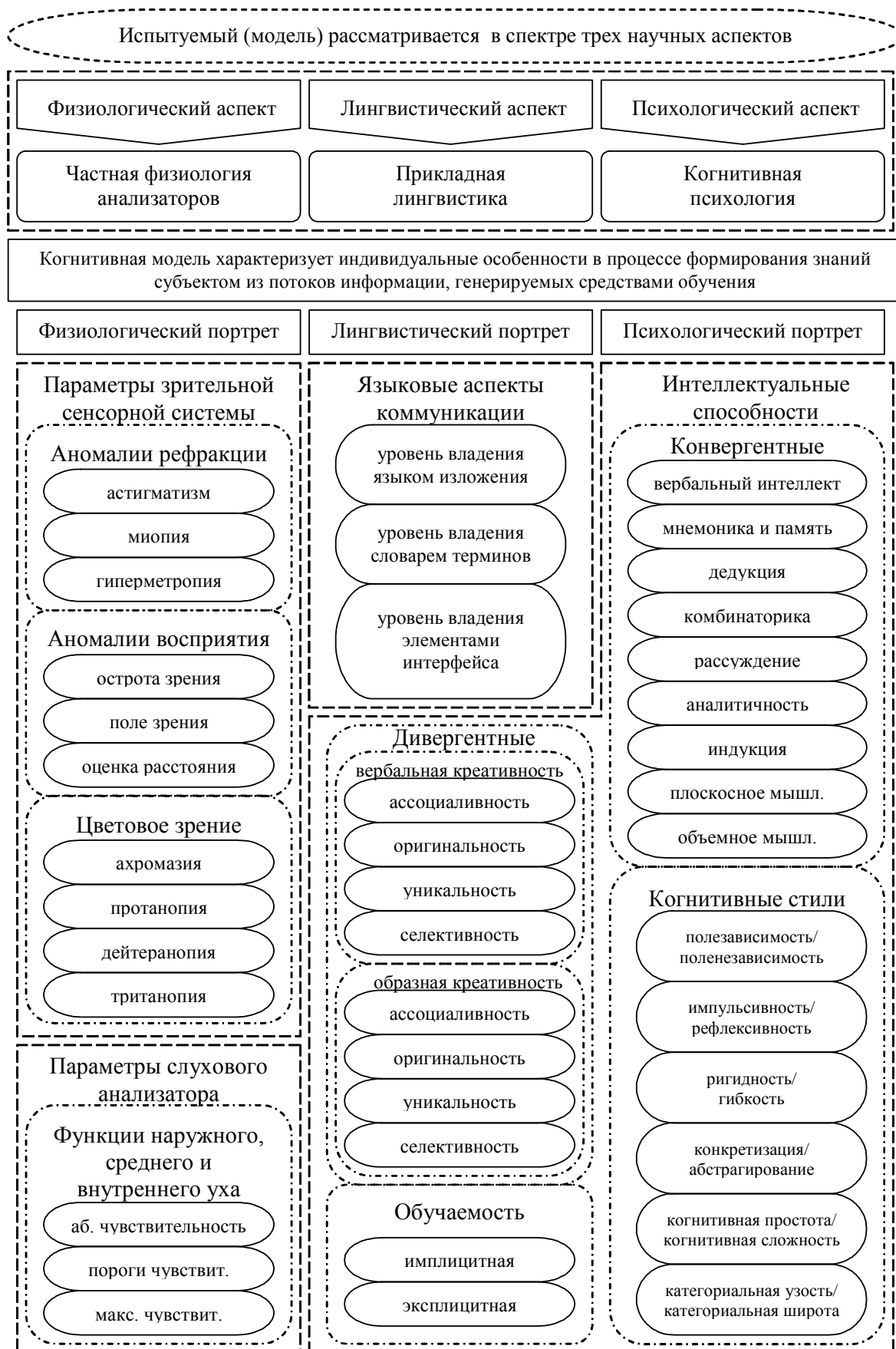
Рис. 3. Когнитивная модель субъекта обучения